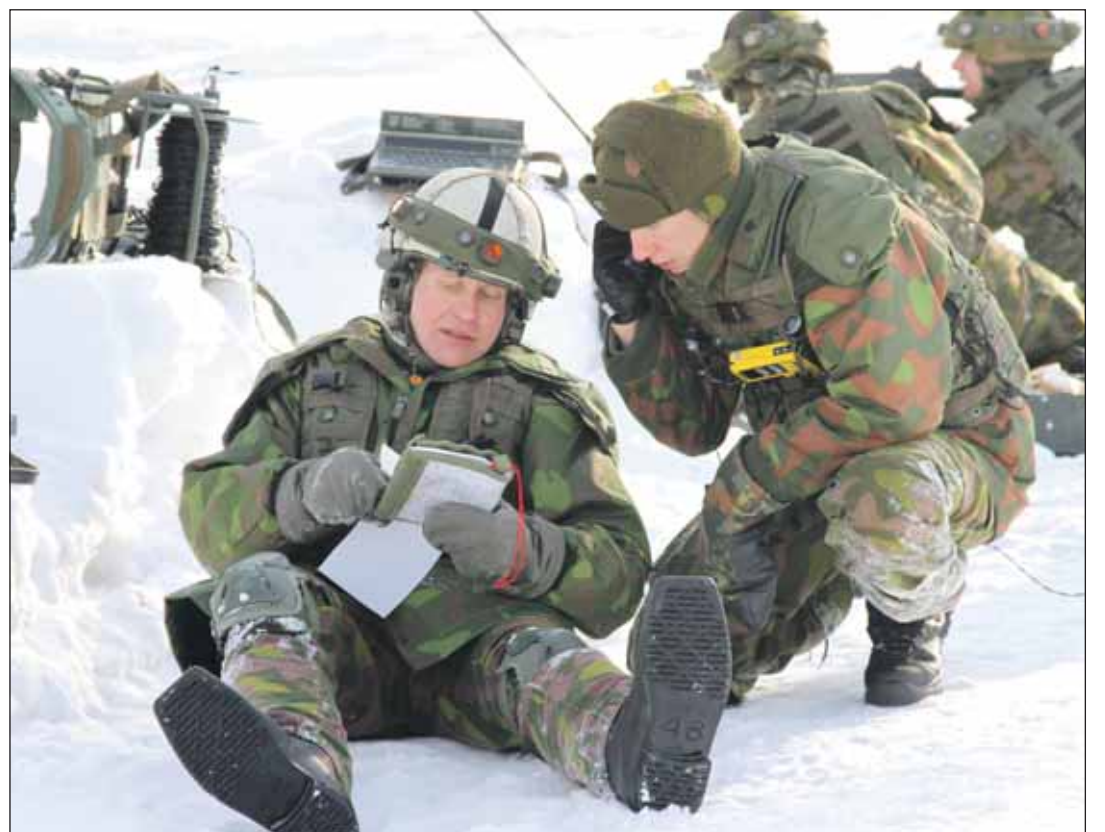
Koordinaatteja annetaan tulenjohtoasemassa.