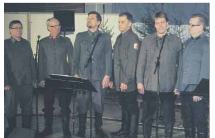
Vilppulan Mieslaulajien lauluryhmä esitti Elämää juoksuhaudoissa yllään suojeluskunta-asut. Kolmannelta oikealta Pirkka-Hämeen suojeluskuntapiirin käsivarsikilpi.