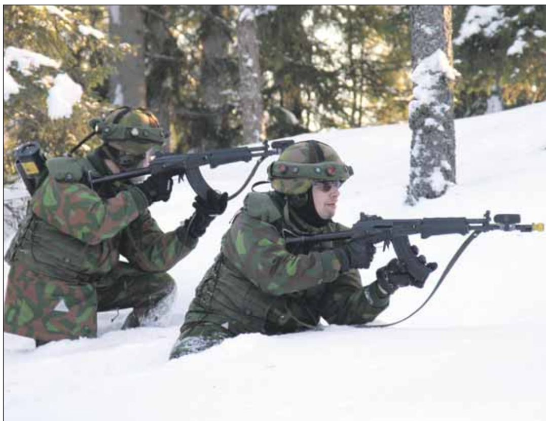
Tarkastusretkeltä palaava joukkue joutui paluumatkalla väijytykseen.