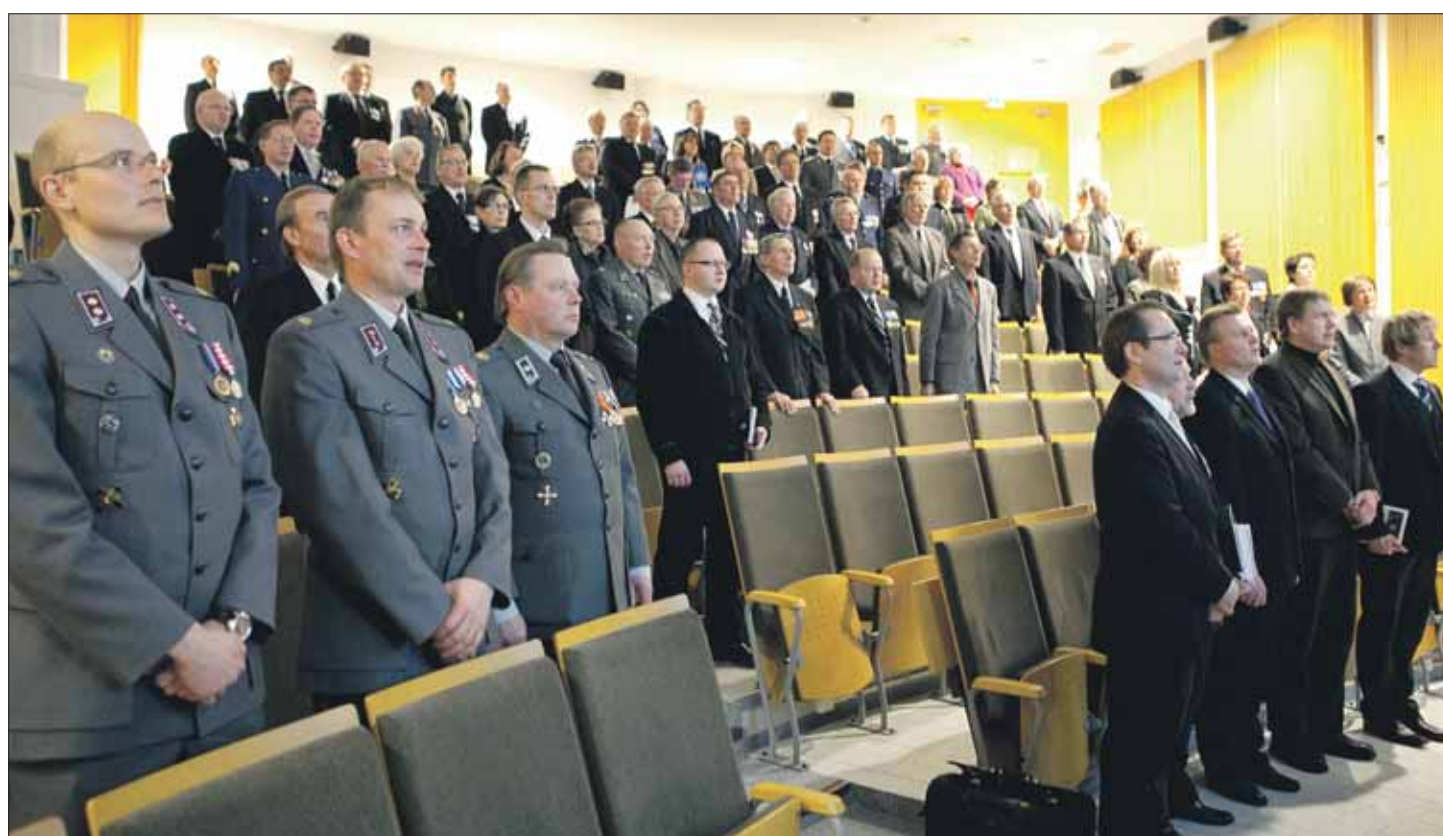
Sylvään koulun auditorio pullisteli piiriväen maanpuolustusjuhlassa, kun Panssarisoittokunta viritti viimeiseen kappaleeseensa Sillanpään marssilaulun sävelet yhteislauluksi.