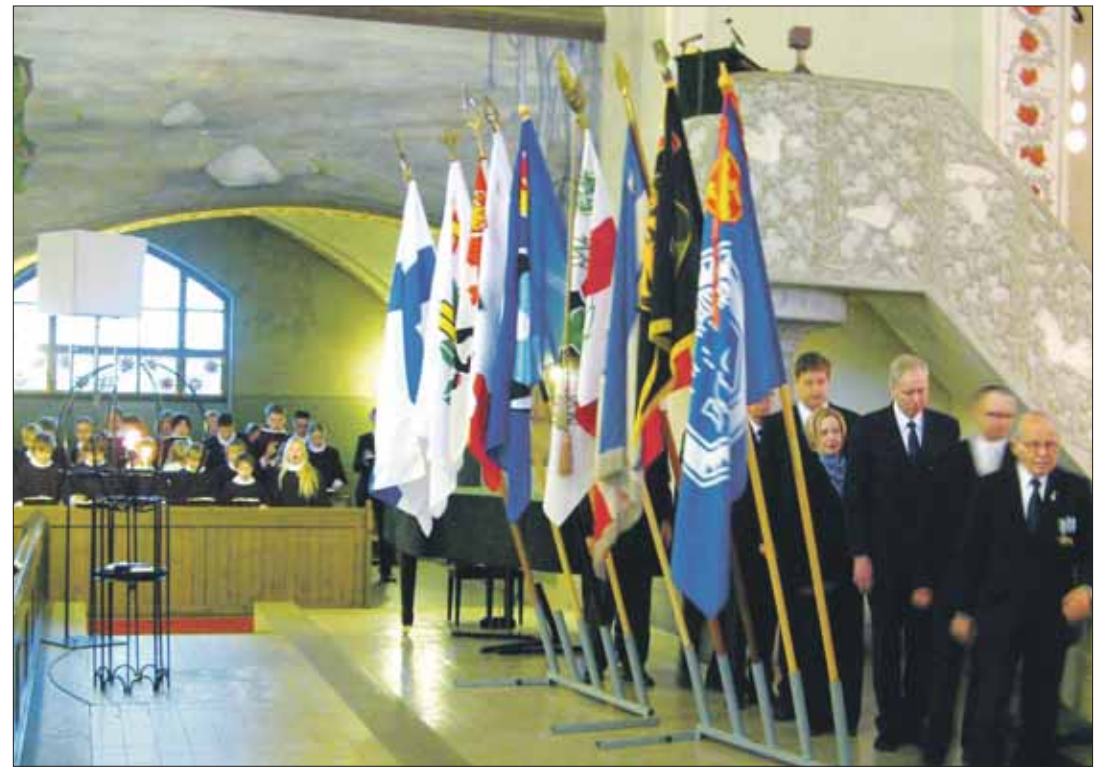
Vapaaehtoisten maanpuolustusjärjestöjen liput