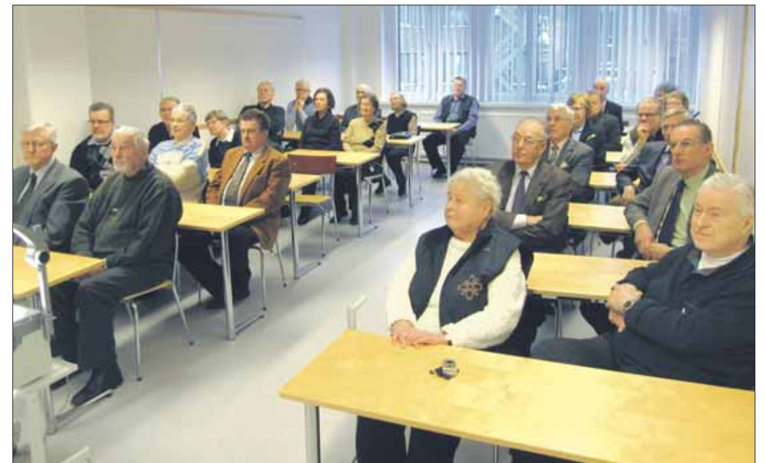
Noin 30 tarkkaavaista kuulijaa seurasi esitelmää.