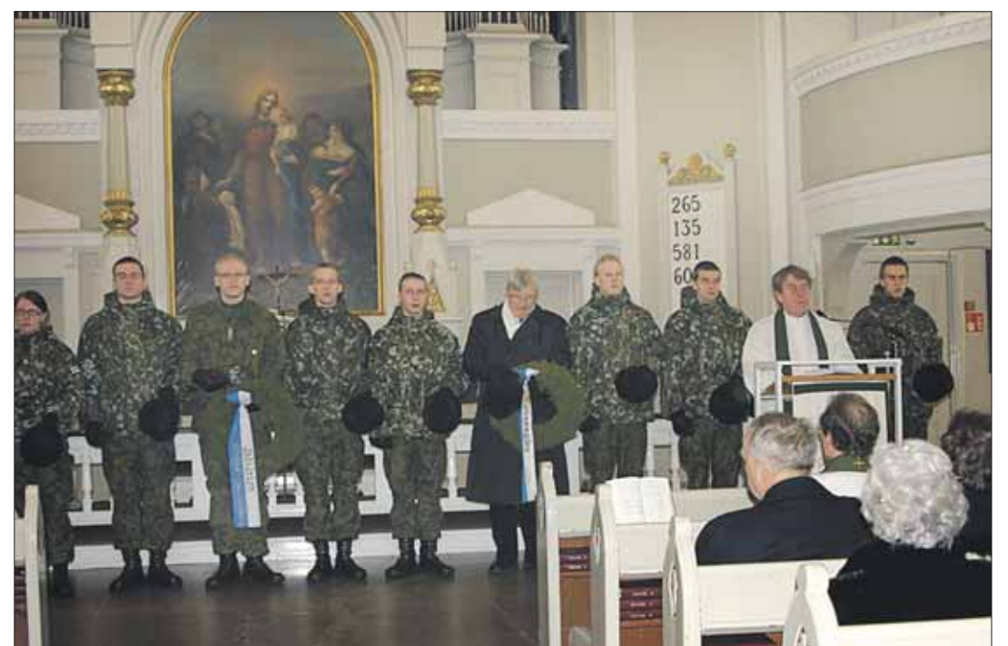
Seppelpartiot lähdössä sankarihautoille Kauhavan kirkossa.

nähdä katkelma draamakonsertista "Tyttö sodassa", jossa nuori lot-tatyttö kaukana poissa kotoa kirjoitti äidilleen, ja kuinka äiti kotona kovassa ahdingossa, miehensäkin ollessa rintamalla, kirjoitti lämpimästi ja lähetti monenlaista tarpeellista lottatyttöilleen.