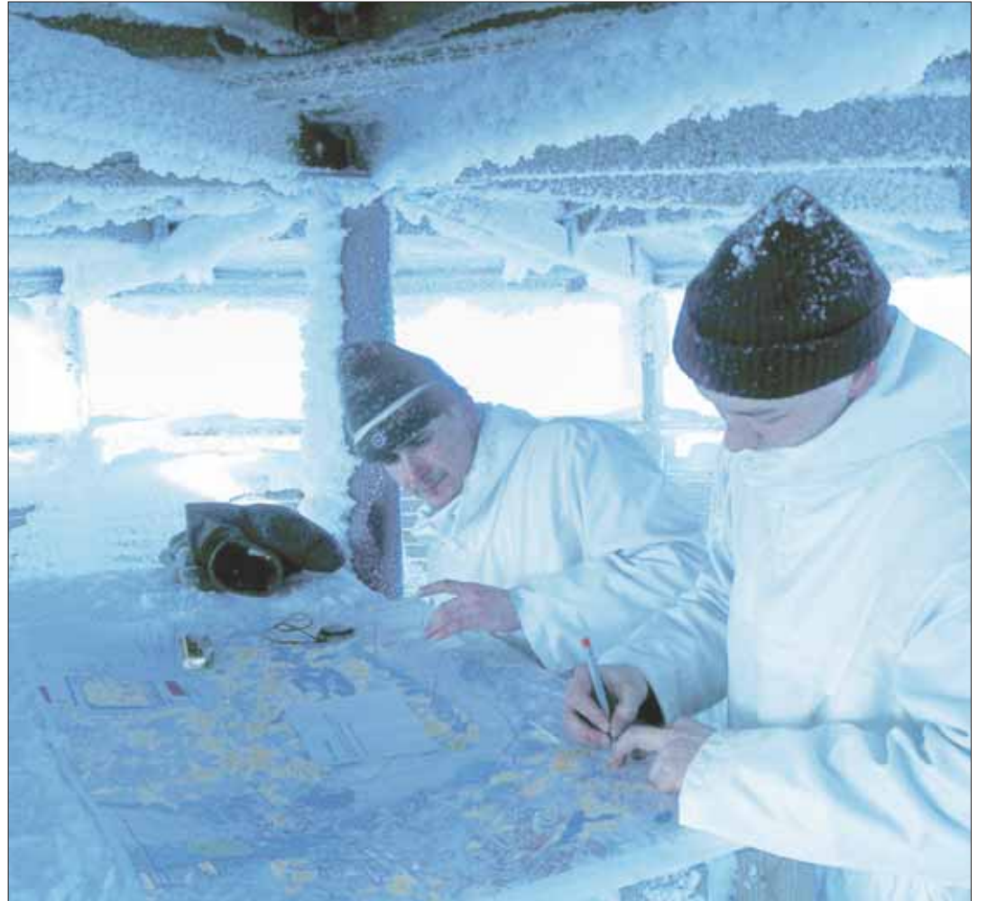
Tykistön maalipisteen määrittäminen käynnissä.

Bush ja CIA tahtovat Lokomon lopettavan sukellusalusten valmistamisen