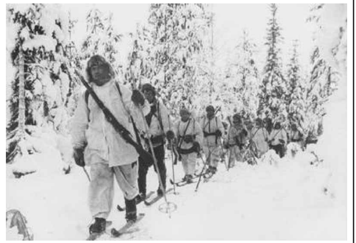
Talvisodan voittojen taustalla olivat suomalaisjoukkojen horjumaton taistelutahto sekä ylivoimainen osaaminen ja liikkuvuus.

Yhden korttisarjan hinta on Reserviläisliiton jäsenille on 15 euroa ja muille 20 euroa. Hinta sisältää postikulut.