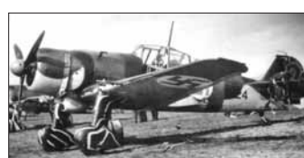
Fokker D XXI. Kuva on Ilmailumuseoyhdistyksen julkaisemasta vuoden 2010 seinäkalenderista. Kuvat ovat Keski-Suomen Ilmailumuseosta.