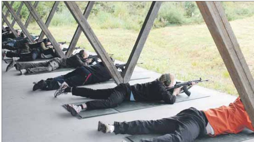
RK-ammunta oli monelle ensimmäinen sitten varusmiesaikojen

Satakunnan lennoston tutustuminen ja F-18 ”Hornetin” tarkastelu lähietäisyydeltä antoi runsaasti uutta ja mielenkiintoista tietoa il-