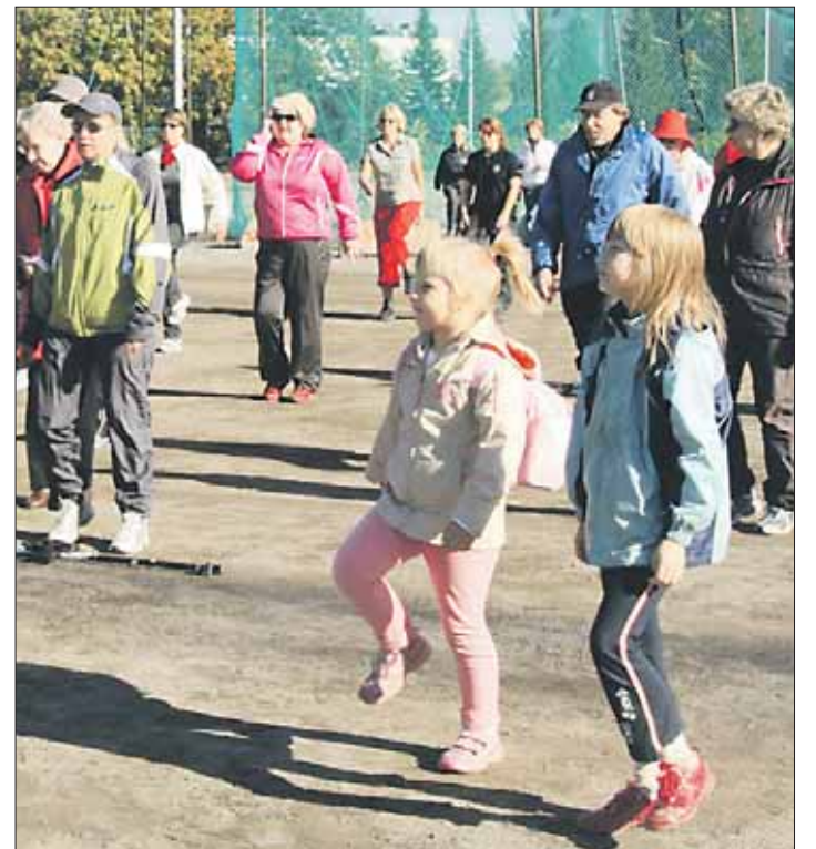
Reserviläisten tavoitteena on saada koko kansa kävelemään, ja ainakin Tampereella siinä onnistuttiin hienosti.