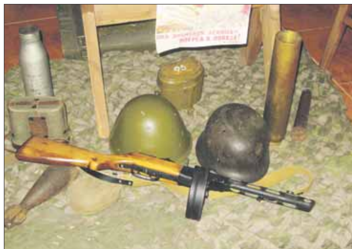
Museoesineistöä, mm venäläisvalmisteinen Suomi-kp.