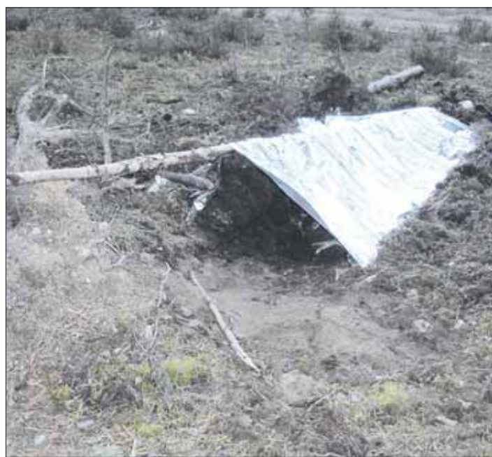
Matalassa majassa on lämmintä, mikäli on saanut jotakin eristettyä maan ja yöpyjän väliin.