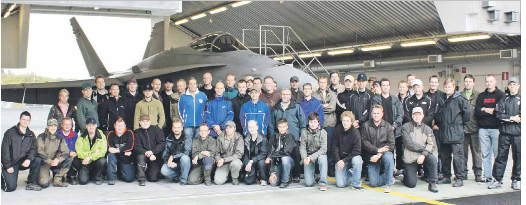
Koko osallistujakaarti yhteispotretissa