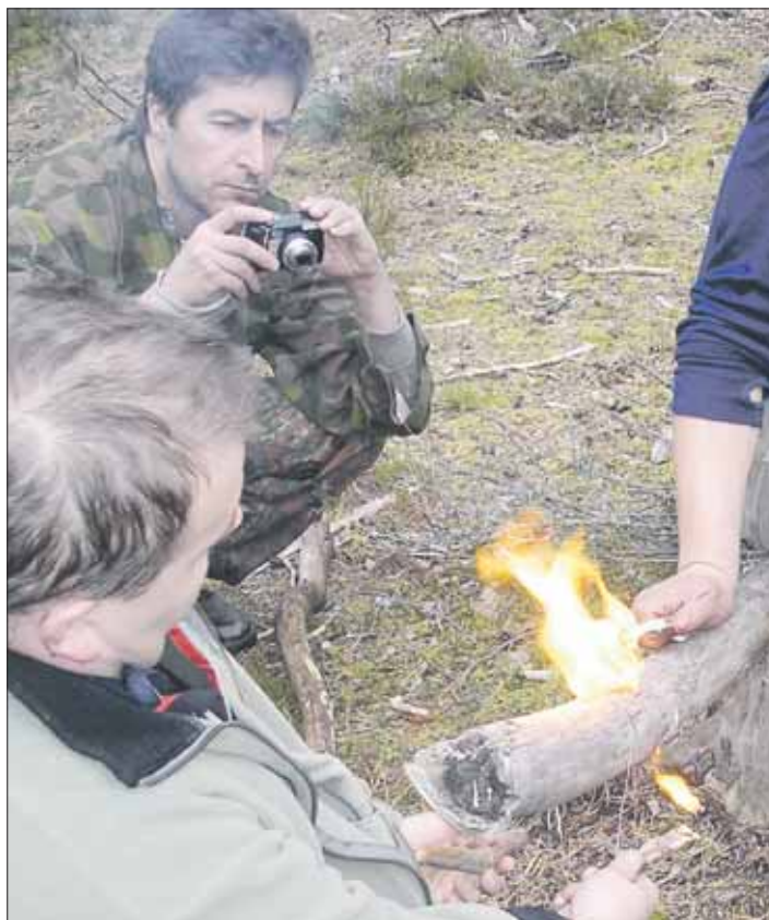
Kitkatuli syttyy rautalangalla ja ruudilla.