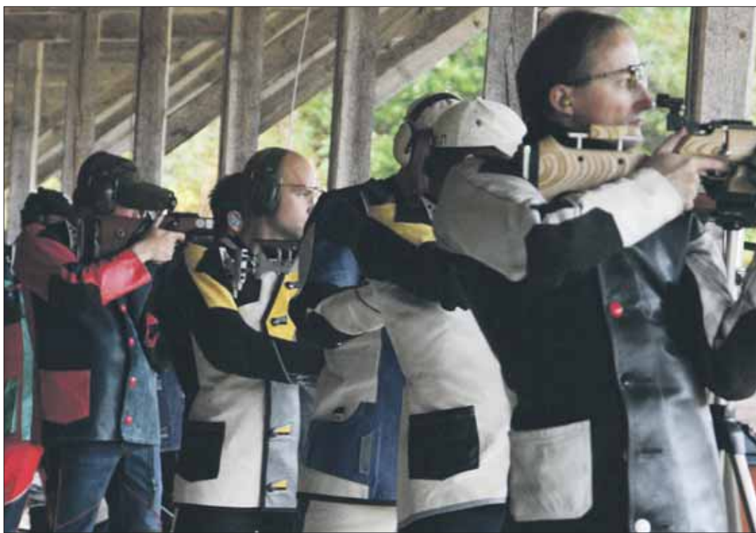
Pienoiskiväärin ammunta käynnissä.

Teksti: Asser Vuola