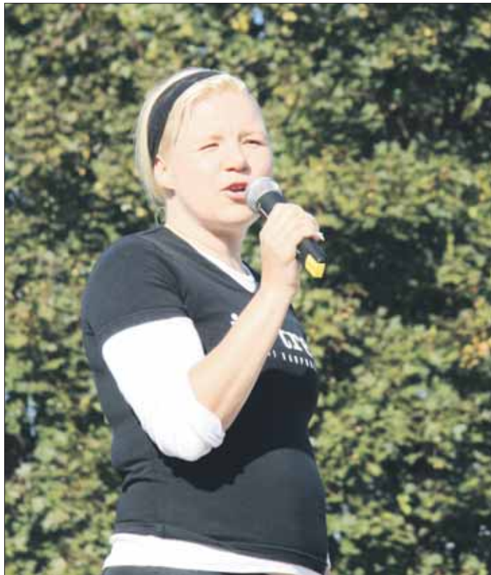
Tampereen kaupungin apulaispormestri Kristiina Järvelä avasi kävelytapahtuman.