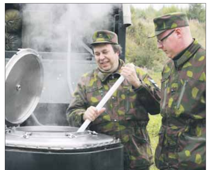
Lihassoppa porisee soppatykissä. Nälkä ei päässyt yllättämään.