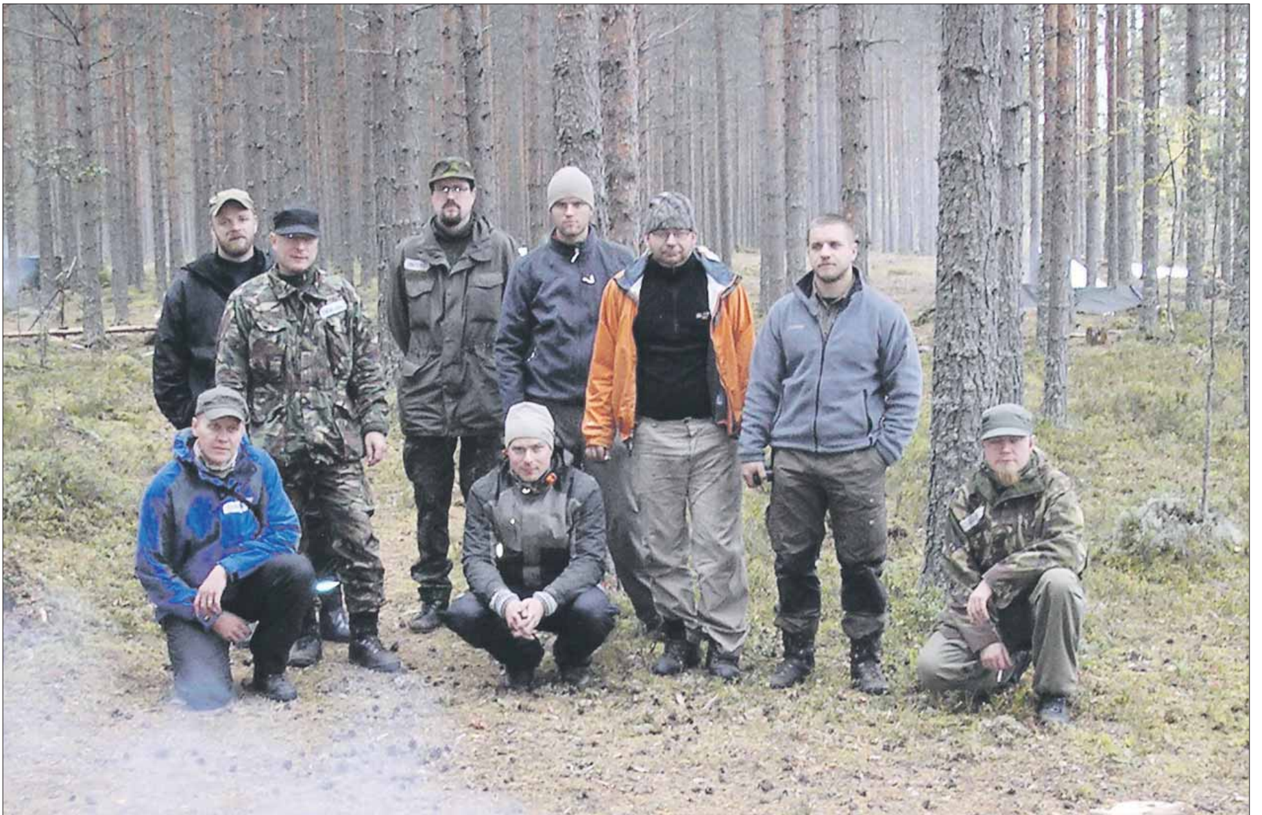
Kurssilaiset toisen yön jälkeen.

Kiilut eli kemialliset valopuikot ovat hyviä merkkivaloja, paksuudesta riippuen ne ovat 1-3 euron hintaisia. Paksumpia voi käyttää työvalonakin leirissä. Sulan maan aikana niitä voi käyttää vielä toisenakin yönä leirin merkkivalona, sillä valmistaja lupaa 12 tunnin valausajan. Jos käy veden- tai puunhakumatalla hämärän aikaan, niin löytää helposti takaisin. Putkipäähine eli resoriputki