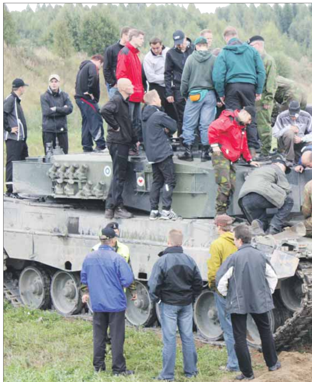
Kuinka monta reserviläistä mahtuu Leopardin päälle?

mavalvonnasta ja puolustuksesta. Hornet oli luonnossa suurempi ja rumempi kuin televisiosta ja valokuvista saatu kuva antoi odottaa. Laitteen viimeistelystä kävi selväksi, että kyseessä on tarkoitukseenmukaisesti rakennettu sotilastyökalu, eikä kiillotettu designnäyttelyesine. Kaiken kaikkiaan lennoston toiminnasta jäi hyvin ammattimainen ja positiivinen mielikuva.