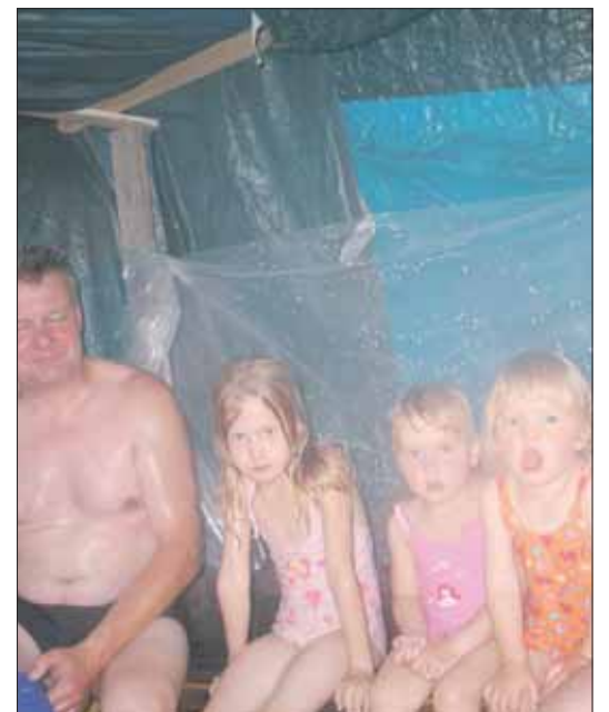
Tytöt ja isät saunassa.

Teksti: Jukka Osara