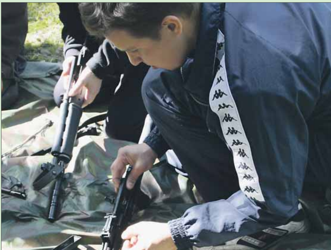
Viidennellä rastilla koottiin monenlaisia aseita.