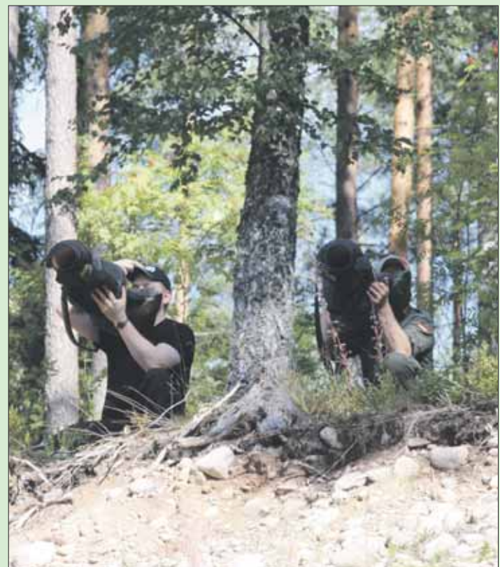
Sinkorastilla tutustuttiin raskaaseen kertasin Apilakseen.