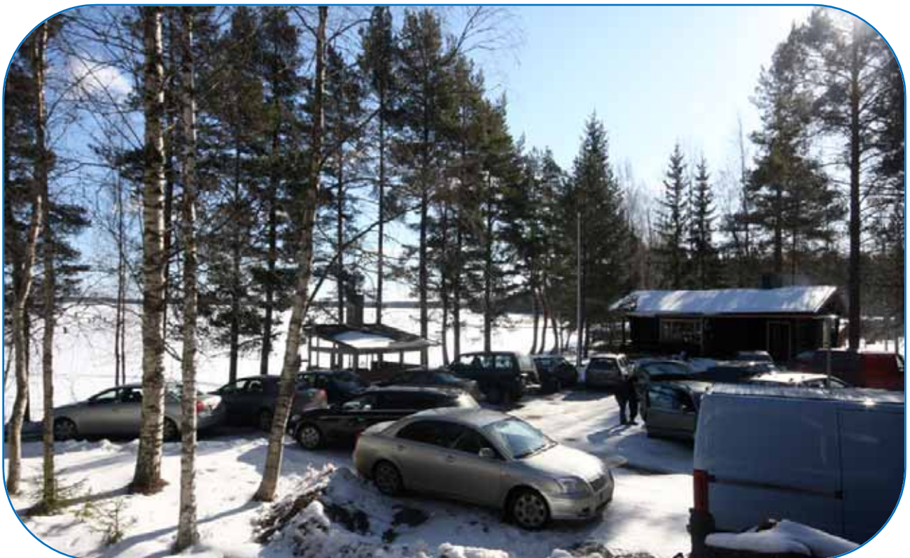
Aamupäivällä majan pihassa oli ruuhka, kuva: Raimo Ojala.