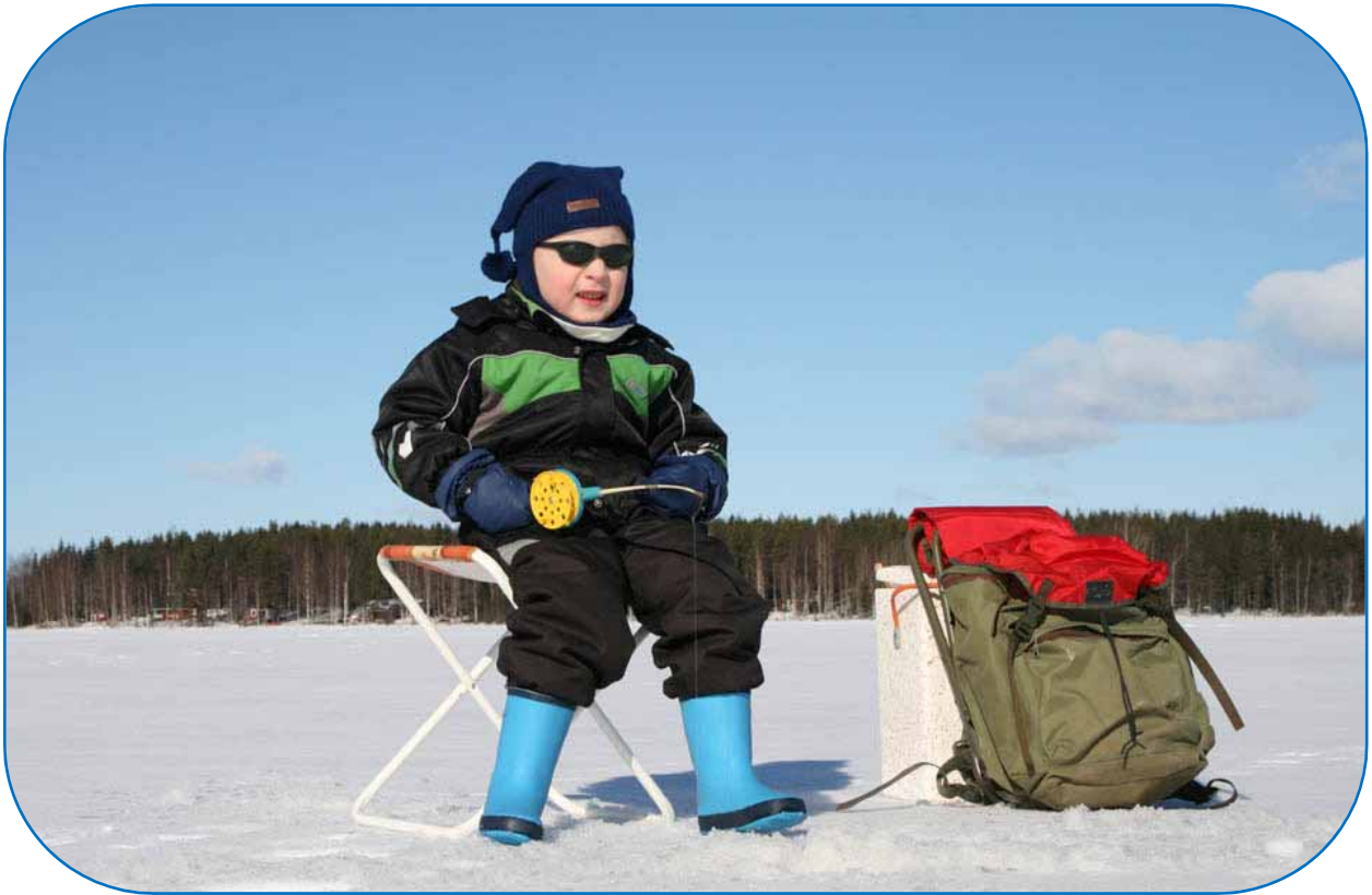
Pilkkiminen on mukavaa...