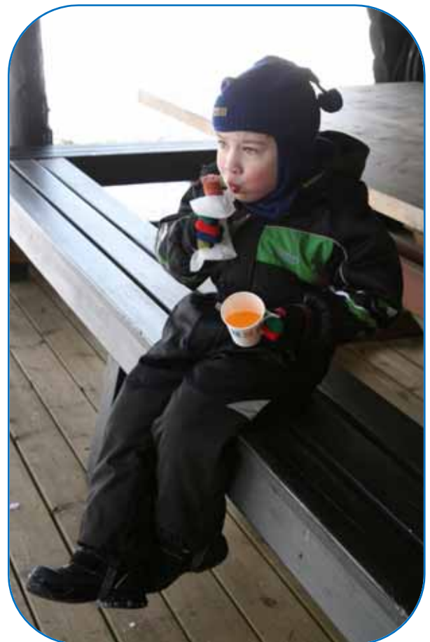
Lämmin makkara ja limppari maistuivatkin hyvältä pilkkimisen jälkeen.