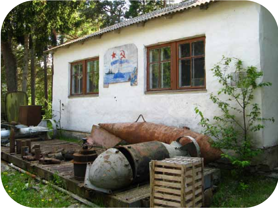
Männiku külan neuvostoaikainen museo.

Seuraavaksi ajeltiin keinuvalla kuorma-autokyydillä miinatehtaalle, joka oli pahoin vandalismista kärsinyt. Siellä miinat varustettiin toimintakuntoon ja kytkettiin ankkureihin. Niille tehtiin myös vesialtaassa tiiveyskoe. Alue oli aikanaan tarkoin vartioitu ja eristetty piikkilanka-aidoin ja vartiotornein. Aidoissa olleet ”äänihälyttimet”, piikkilangoista roikkuvat tyhjät, ruostuneet säilykepurkit ovat edelleen jäljellä.