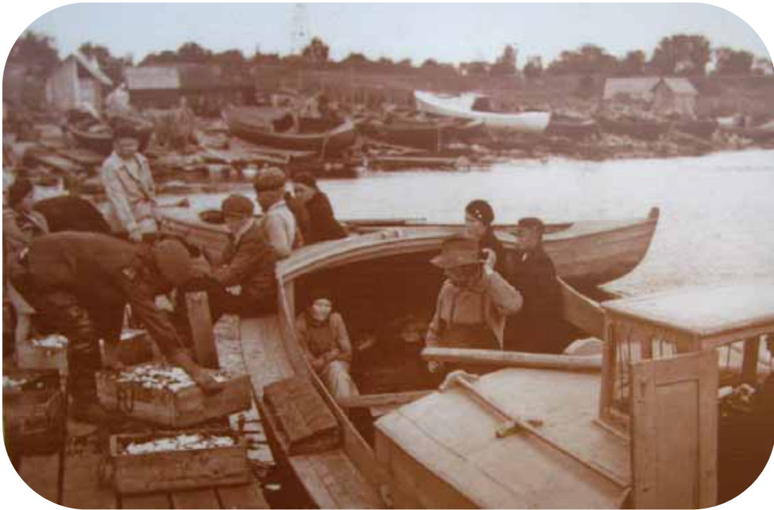
Kalastajat purkavat saalistaan Naissaaren satamassa 1936.

Venäläiset valloittivat Tallinnan 1710 ja jatkoivat saaren linnoittamista 1720-luvulla. Brittilaivasto tuli ruotsalaisten apuun vuosina 1808-1810. Krimin sodan aikana 1854-1855 ranskalaiset nousivat saarelle kaksikin kertaa. 1800-luvun lopulla saari toimi balttiansaksalaisten lomasaarena.