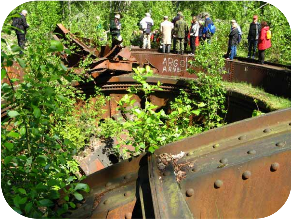
Tykkipatterin 10b vasemmanpuoleisen tykin raunio.

Seuraava kohde oli miinoja sisältävät avoimet platformit 52 kpl. Kaikille johtaa satamasta ja miinatehtaasta kapearaiteinen rautatie. Rautatien ratapölkkyt ovat betonia.