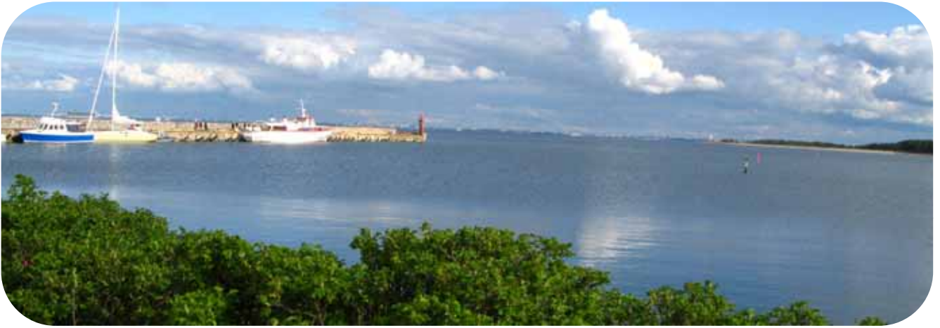
Naissaaren satama, taustalla horisontissa Tallinna.