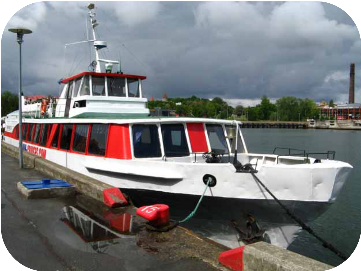
Naissaaren ajava pikkulaiva.

Saarelle seilaa pieni laiva Tallinnan satamasta. Perillä turisteja kuljetetaan neuvostoaikaisilla kuorma-autoilla ja kapearaiteisella junalla. Mukaan voi ottaa polkupyörän ja kulkea sillä omatoimisesti ja tietysti myös patikoida voi vapaasti. Saarella on todettu pesivä 140 eri lintulajia.