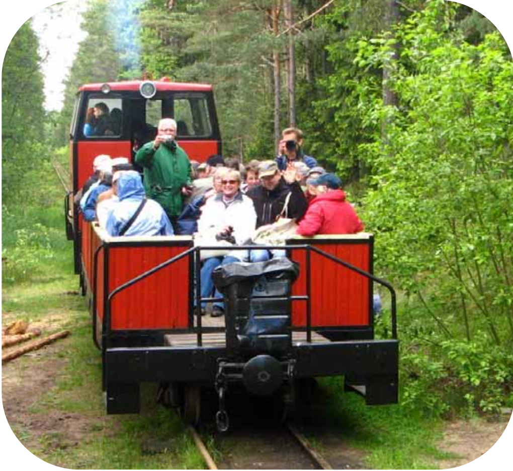
Junamatka satamaan alkaa.

Rauhallisen ja hyvän lounashetken jälkeen paluumatka alkoi Männikun rautatieasemalta kapearaiteisella junalla Naissaaren satamaan ja sieltä pikku laivalla Tallinnaan.