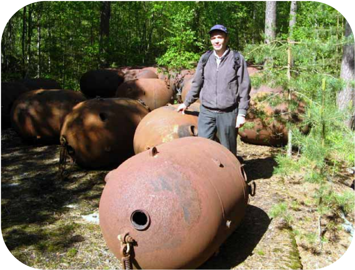
Tyhjiä miinan kuoria platformilla.

miinatehtaassa ne varusteltiin toimintakuntoon. Jokainen miina sisälsi 300 kg räjähdettä ja jokaisella platformilla oli 150 miinaa eli yhteensä 7.800 miinaa ja räjähteitä n. 2 milj kg. On ihmetelty sitä, miksi miinat olivat avoimilla platformeilla satelliittitiedustelun näkyvillä.