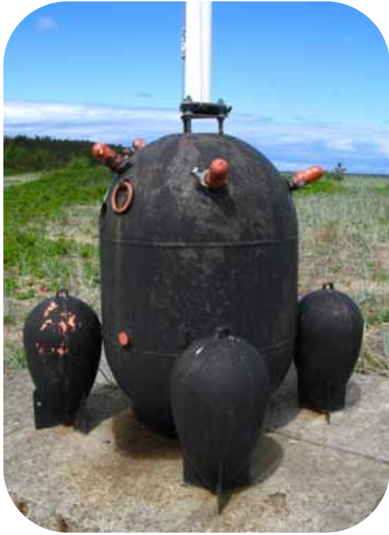
Naissaareen satamassa 300 kg:n miina lipputangon jalustana.