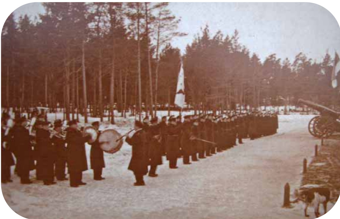
Viron itsenäisyyden 20-vuotisparaati Naissaarissa 24.2.1938.