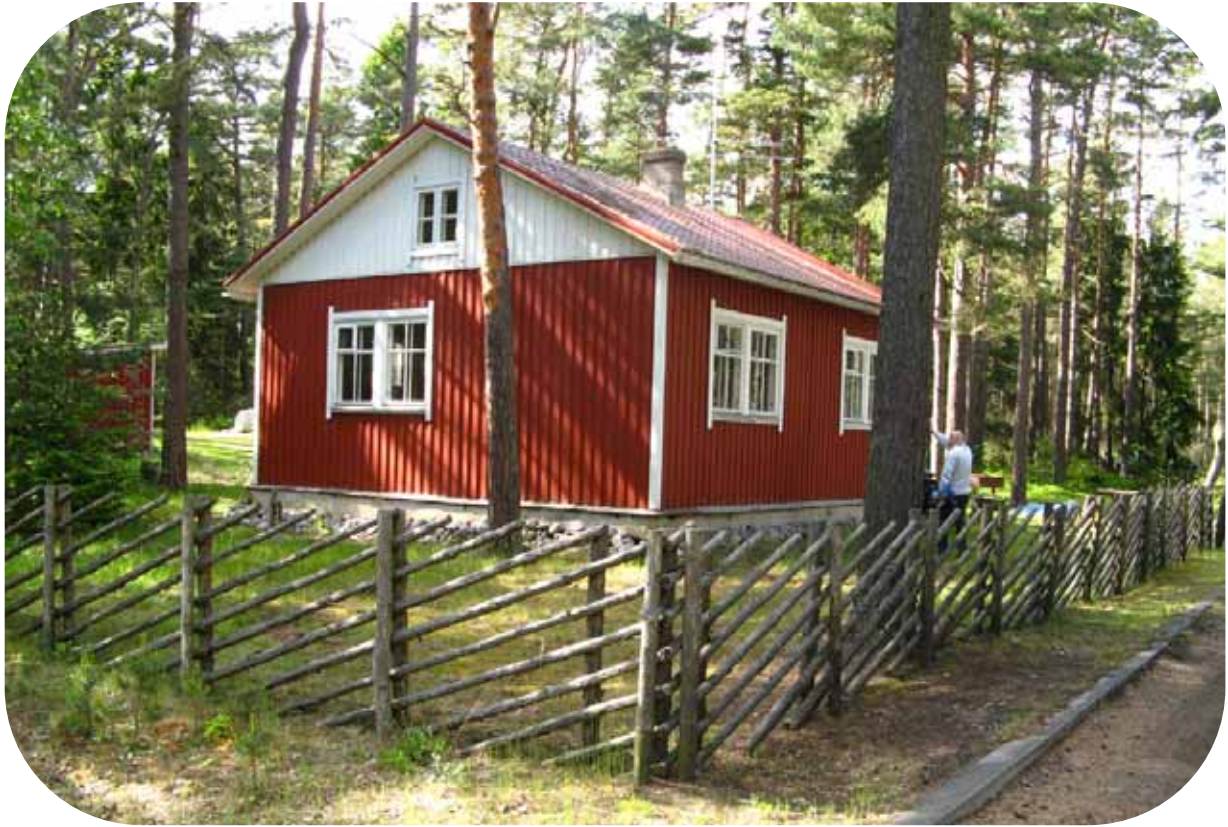
Suomen sotakorvauksena toimittama Enson viipalealo Männiku kylässä.