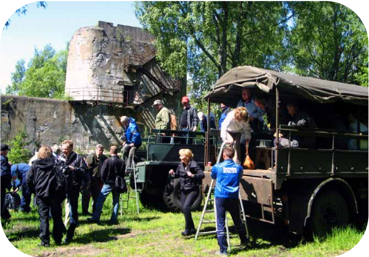
Tulo tykkipatterille 10b.

Naissaaren satamassa odotti kolme neuvostoaikaista kuorma-autoa, joihin kiipesimme tikkaita pitkin. Saaren kapeilla teillä autot keinahelivat hauskesti ja puiden oksat sukivat matkustajien olkapäitä. Mikään varsinainen sunnuntai-turistin kohde paikka ei ole.