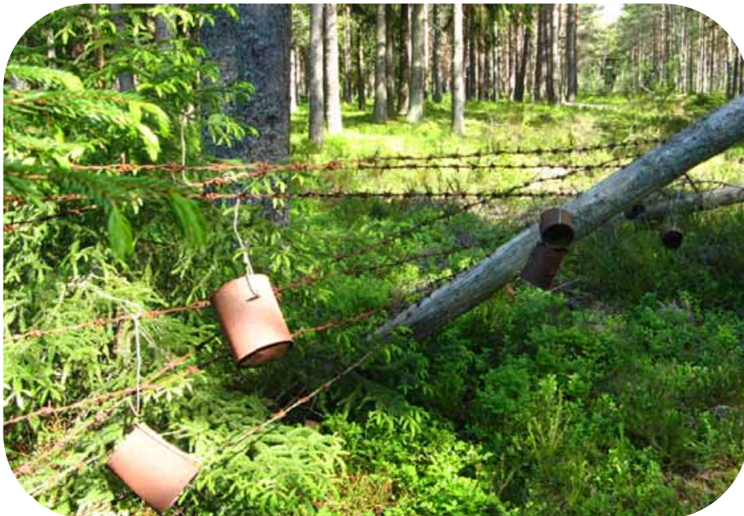
Miinatehtaan piikkilanka-aitaa ja 'äänihälytysjärjestelmä.

Seuraava kohde oli miinoja sisältävät avoimet platformit 52 kpl. Kaikille johtaa satamasta ja miinatehtaasta kapearaiteinen rautatie. Rautatien ratapölkkyt ovat betonia.