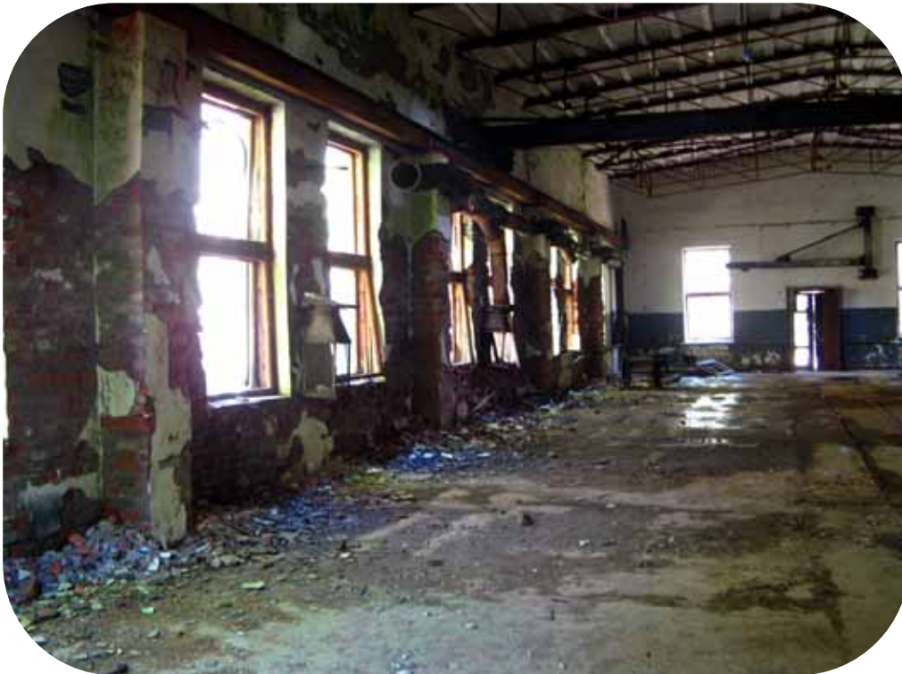
Miinatehdas vandalismin jäljiltä.

Kun saari jäi tyhjäksi ja vartioimatta, ei mennyt kauaakaan, kun yksityiset henkilöt tulivat ja ottivat kaiken irti, minkä saivat ja mitä tarvitsivat ja kuljettivat pois omiin tarpeisiinsa tai myytäväksi. Saaren rakennukset ovatkin vandalismin jäljeltä surkeassa kunnossa. Myönteisen poikkeuksen muodostavat Suomen ensimmäisinä sotakorvauksina Neuvostoliitolle toimittamat Enson viipaletalot. Ne aikanaan pystytettiin tänne ja ne ovat vieläkin tyylikkään kauniit ja hyvässä kunnossa.