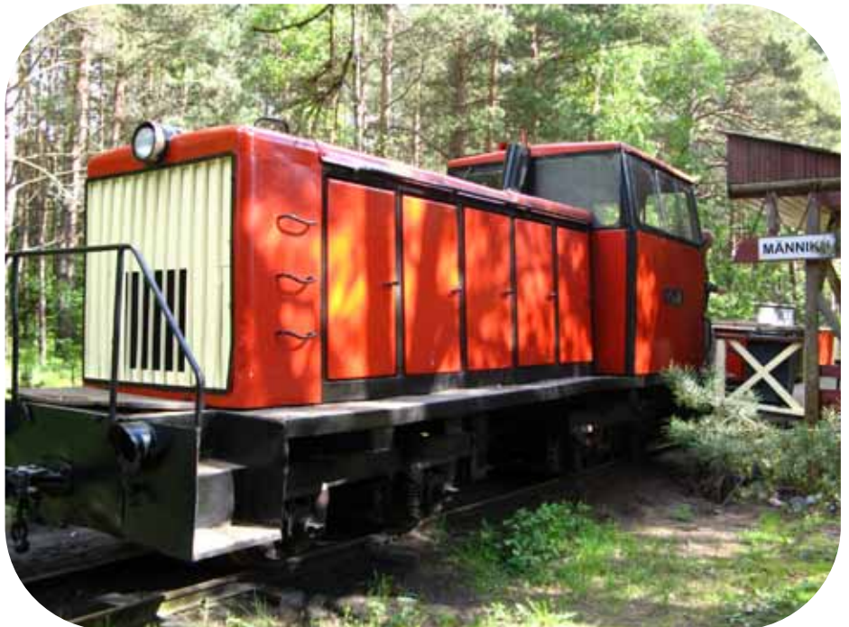
Männiku külan rautatieasema.

Rauhallisen ja hyvän lounashetken jälkeen paluumatka alkoi Männikun rautatieasemalta kapearaiteisella junalla Naissaaren satamaan ja sieltä pikku laivalla Tallinnaan.