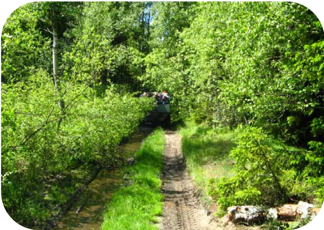
Matkantekoa kuorma-autolla Naissaaren teillä.

Lähteet: Sshs:n matkatiedote, Wikipedia ja oppaiden selostukset.