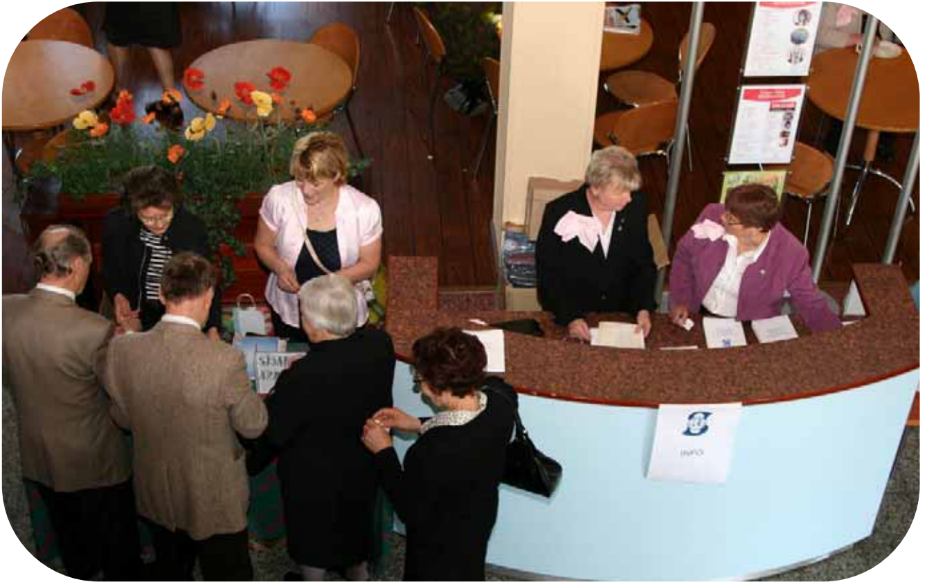
Ikaalisten Maanpuolustusnaiset hoitivat arpojen myynnin.