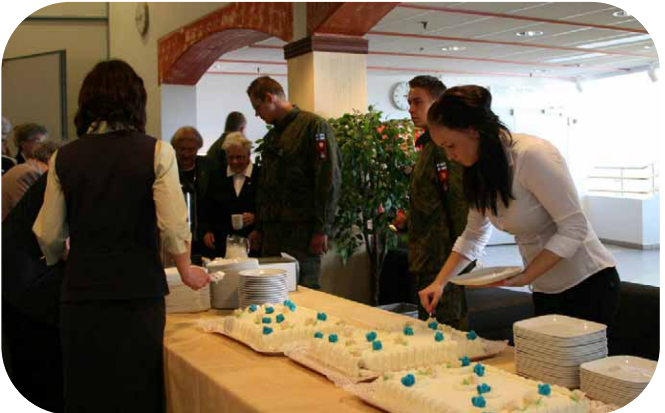
Ennen kotimatkaa saatiin vielä nauttia kakkukahvit. Avustajina Kylpylässä oli molempina päivinä Niinisalon Tykistörikaatin reippaita varusmiehiä.