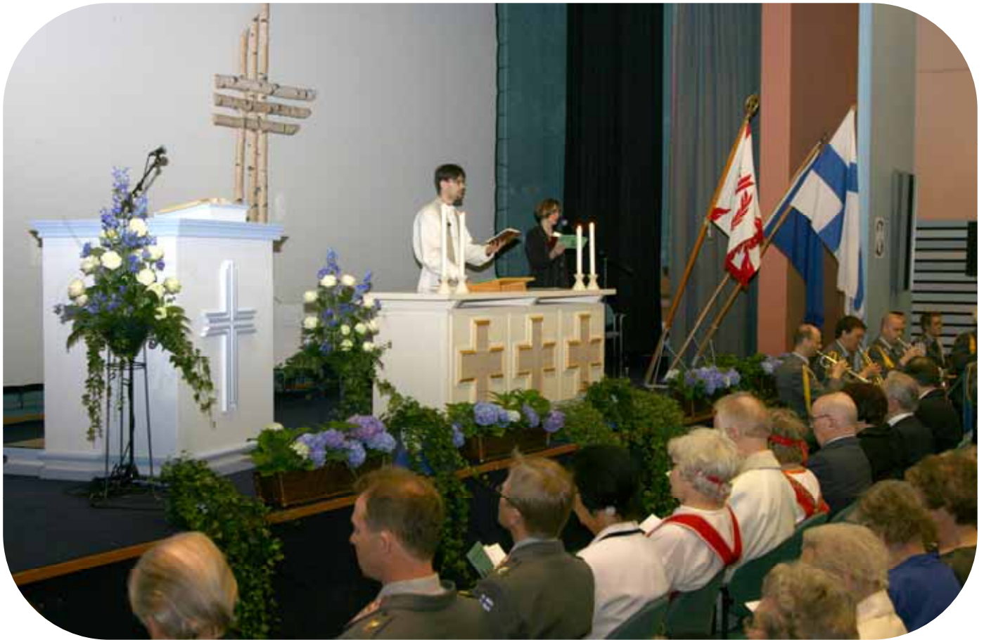
Juhlajumalanpalvelusta varten Maininki-saliin pystytettiin upea alttari.